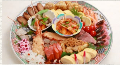
鉢盛り (約10名様分) Japanese Appetizers (for 10set)

税抜 ¥12,000 (税込 tax incl. ¥13,200) tax excl.