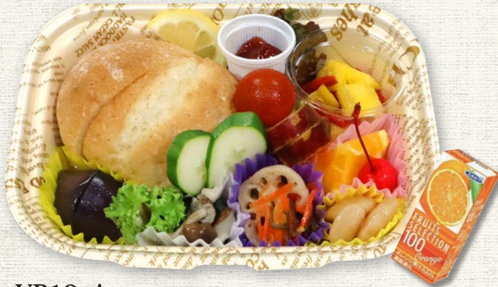
VB10-A (Size: 22cm×16cm / Max: 1,500 個)

サンドBOXはパックジュース付き・お弁当はパック茶付き All lunch boxes come with packed tea or packed juice.