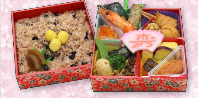
※例:お祝い二段重① 税抜 ¥1,800 (税込 tax incl. ¥1,980) Example: Celebration two-tiered bento box ①

We can make original boxed lunches for various events, academic conferences, and for various purposes. Please feel free to contact us.