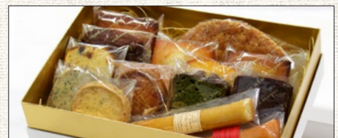
※例:詰め合わせ② (14個入/箱サイズ190×285mm) ※Example: Boxed sweets ② (14 pieces)