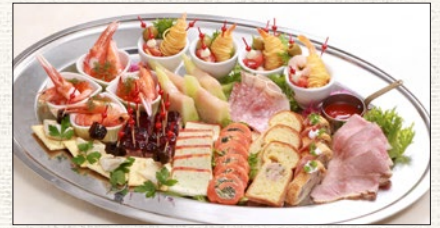
オードブル盛合わせ (約10名様分) Western Appetizers (for 10set)

税抜 ¥12,000 (税込 tax incl. ¥13,200) tax excl.