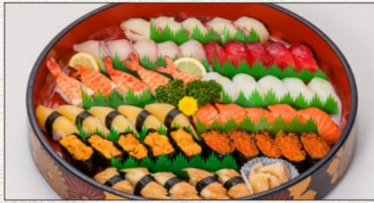
寿司桶盛り Assorted Sushi

税抜 ¥12,000 (税込 tax incl. ¥13,200) tax excl.