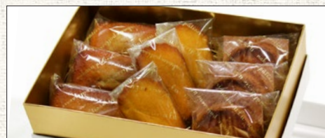
※例:詰め合わせ① (9個入/箱サイズ145×215mm) ※Example: Boxed sweets ① (9 pieces)

We also make baked sweets according to your budget. Please feel free to contact us.