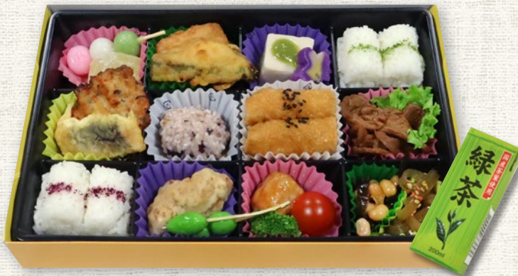
VB15-C (Size: 27.5cm×18cm / Max: 1,500 個)

税抜 ¥1,500 (税込 tax incl.) tax excl. ¥1,650