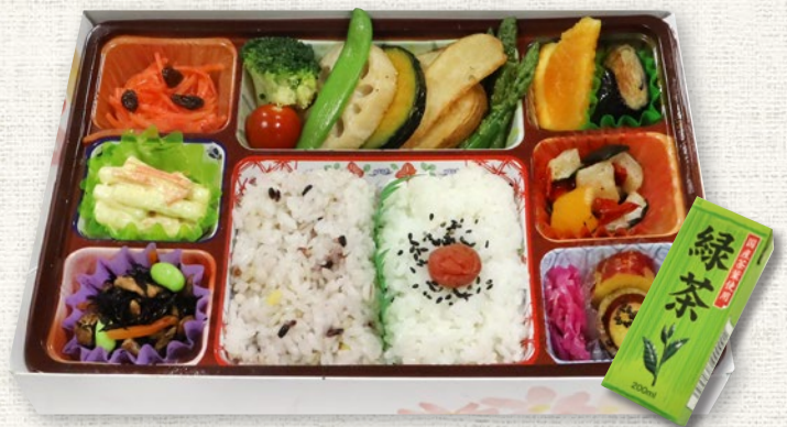
VB15-D (Size: 27cm×18cm / Max: 1,000 個)

三色団子 / わらび餅 / 豆腐ナゲット / おくらコーン天ぷら / 胡麻団子 / 花麩 / 白御飯・青海苔 / 豆腐ハンバーグ / 山芋磯辺揚 / 十五穀饅頭 / いなり寿司 / 大豆ミートの焼肉風 / 白御飯・ゆかり / 大豆の唐揚 / 串銀杏 / ベジ団子の玄米黒酢餡かけ / ミニトマト / ブロッコリー / 昆布豆 / おきうと Three-colored dumpling skewer / Warabimochi starch cake / Tofu nugget / Okra and sweetcorn tempura / Sweet deep-fried sesame ball / Petal-shaped gluten / Steamed rice · Seaweed / Tofu steak / Yama grilled in seaweed / 15-grain manju dumpling / Inari-sushi / Grilled soybean meat / Steamed rice · Yukari leaf / Deep fried soybeans / Ginkgo nut skewer / Vege dumpling in rice vinegar sauce, etc.