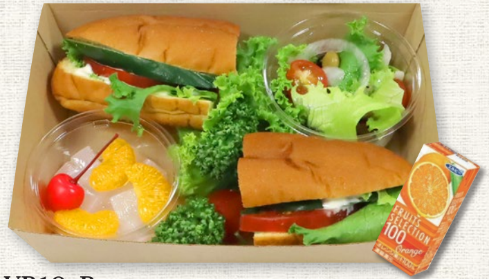
VB10-B (Size: 20cm×14.5cm / Max: 300 個)

ソフトカンパニユ / いちごジャム / パプリカの甘酢漬 / なすのピリ辛煮びたし / レンコンと野菜のマリネ / 白豆の甘煮 / 紅あずまのレモン煮 / フルーツ(オレンジ・チェリー) / キュウリ / トマト Soft Campagne / Strawberry jam / Pickled paprika peppers / Spicy boiled eggplant / Lotus root and vegetable marinade / Sweet boiled white beans / Lemon simmered sweet potato / Fruit (orange/cherry) / Cucumber / Tomato