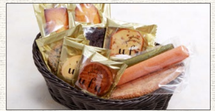
焼き菓子盛合わせ (約10名様分) Baked sweets (for 10pieces)

税抜 ¥7,500 (税込 tax incl. ¥8,250) tax excl.