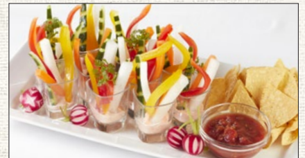
ベジタブルスティック (約10名様分) Vegetable sticks (for 10set)

税抜 ¥4,000 (税込 tax incl. ¥4,400) tax excl.