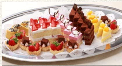
ケーキ盛合わせ (約10名様分) Cakes platter (for 10set)

税抜 ¥5,000 (税込 tax incl. ¥5,500) tax excl.