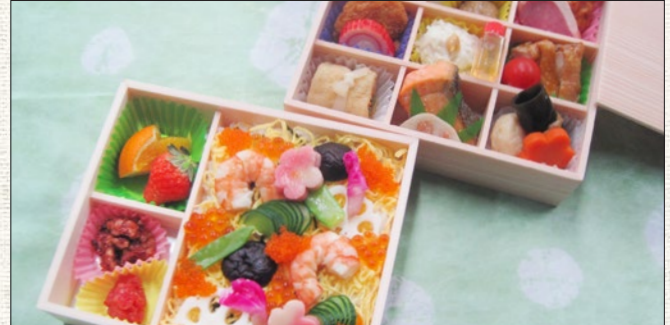
※例:お祝い二段重② 税抜 ¥2,000 (税込 tax incl. ¥2,200) Example: Celebration two-tiered bento box ②