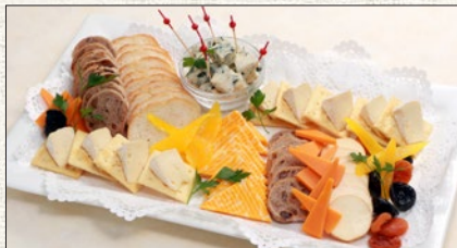
チーズ盛合わせ (約10名様分) Cheese platter (for 10set)

税抜 ¥6,000 (税込 tax incl. ¥6,600) tax excl.