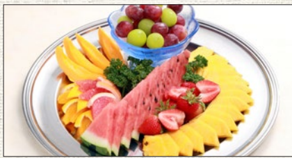
フルーツ盛合わせ (約10名様分) Fruits platter (for 10set)

税抜 ¥4,000 (税込 tax incl. ¥4,400) tax excl.